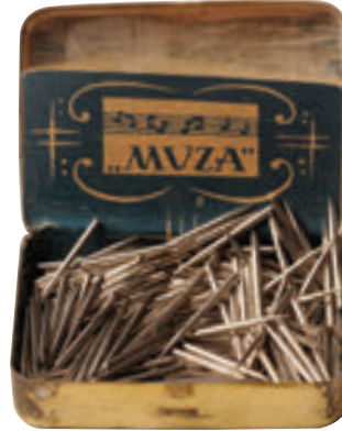
Gramofon ve plak iğnesi kutuları.