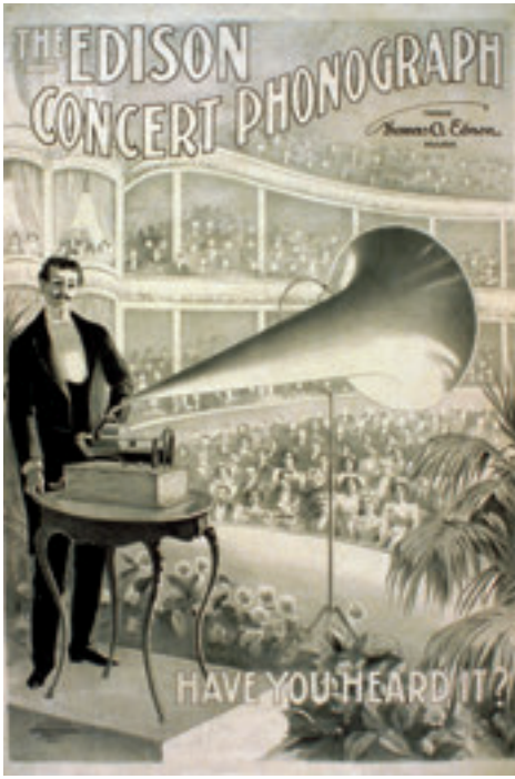
1899. "Bunu duydunuz mu?" başlıklı Edison Fonograf Konseri reklâm afişi. Altta, Edison markalı sanayi üretimi bir fonograf.