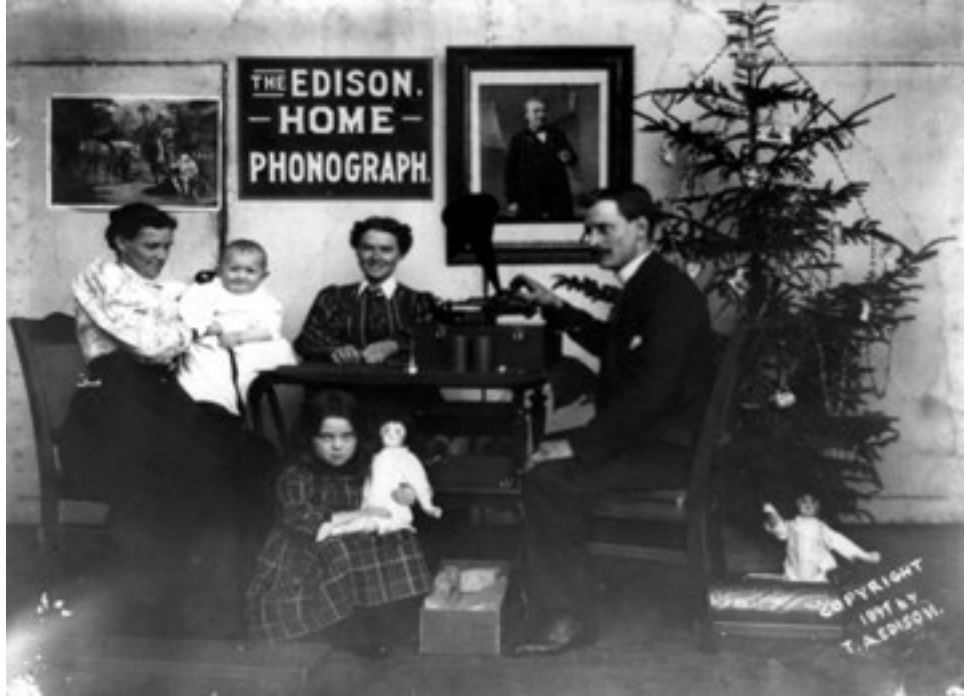
1897. Fonograf dinleyen bir aile fotoğrafı.

kanizmasıyla ilgilenen ve sağır-dilsizlerin eğitimiyle ilgili sorunları çözmeye çalışan İskoç bilim adamı Alexander Graham Bell (1847-1922) bu çalışmalarından haberdar oldu. Bell, incelemeleri sırasında Helmholtz'un "İşitme Duyusu Açısından Müziğin Fizyolojik Teorisi" (1863) adlı eserinden, elektromıknatısın etkilediği bir diyapazon aracılığıyla nasıl sesler elde edilebileceği hakkında fikir edinmişti. 1872'de Boston Üniversitesine ses fizyolojisi profesörü olarak atanan Bell, 1875'te telgraf manipülasyonu aracılığıyla bir diyapazonu titreştirebildi. Sonra diyapazonun yerine mıknatıslı maden parçaları kullandı ve kuru bir ses çıkararak elektromıknatısa gidip yapışıklarını gözlemledi. Ani bir esinlenmeyle, maden parçacıklarının yerine bir zar yerleştirdi ve zarı titreşimlerine göre direnci değişen bir elektrik devresine bağladı. 10 Mart 1876'da, telin öbür ucunda çalışmakta olan asistanına seslendi: "Bay Watson, gelin! Size ihtiyacım var." Patronunun sesini duyan Watson şaşkın ve ürkek bir tavırla koşup geldi. Bu, ilk telefon konuşmasıydı.