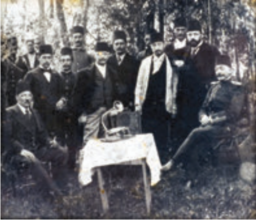
1895. Fonografin icat edildiği dönem. Fonografin en ibtidai örnekleri hemen Osmanlı topraklarında gelmişti.