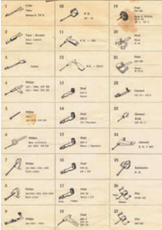
Pikap iğnesi kataloğundan bir sayfa.