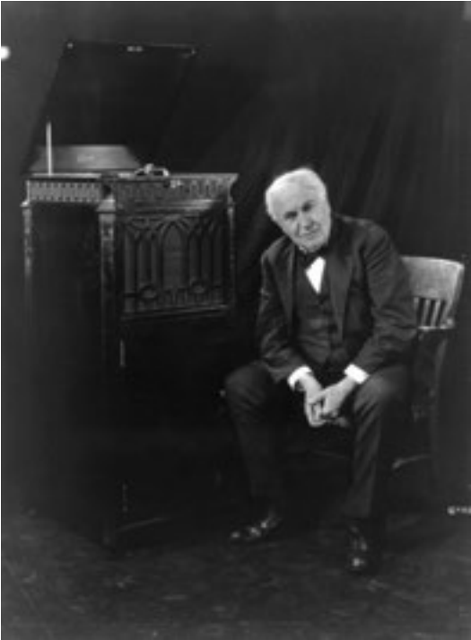
1921. Thomas Edison fonografin yanında poz veriyor.

temlerini geliştirmek içinse manyetik ilkeleri kullanıldı. Bu sistemler, 1935'te manyetik plastik şeridin devreye girilmesiyle, 1960'larda mikroelektronik kullanılmasıyla büyük bir ticari başarı kazandı. Gramofonun yaygın olarak kullanılmasını sağlayabilecek cazip gelişmeler, teyp cihazlarının pikapların yerini almasına mâni olamamıştır. Teyp cihazları, gramofona oranla; kaydedilen sesin daha net olarak ve uzun süre sonra dinlenebilmesi, daha kolay kullanılabilmesi, bu cihazlarda kullanılan kasetlerin ucuz ve çabuk çoğaltılabilmesi ve üstüne başka kayıt yapılabilmesi gibi kolaylıklar sağlamıştır.