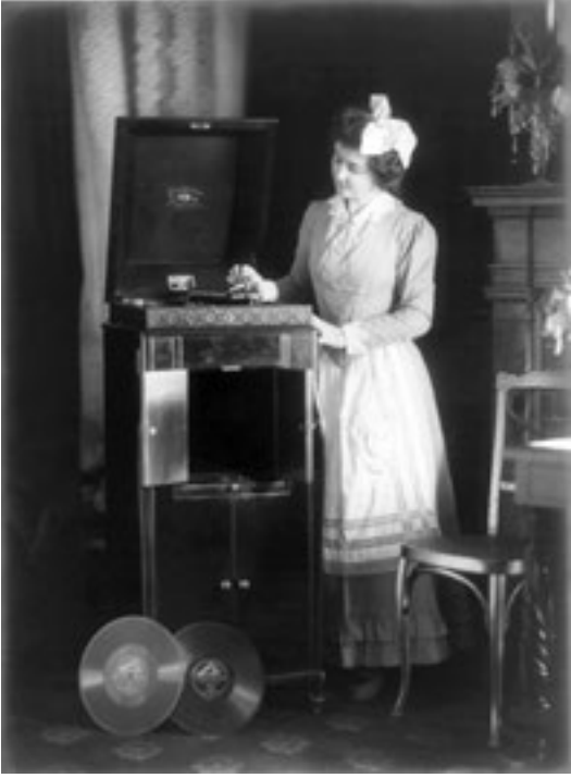
1900. Bir hanım fonografda disk çalıştırıyor.