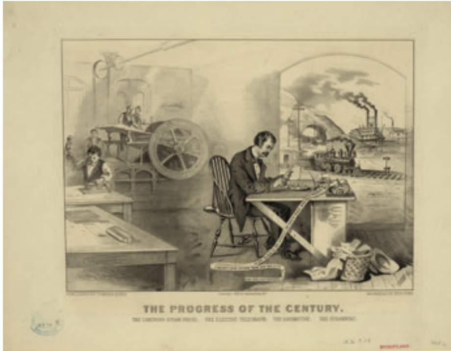
1876. "Yüzyılın ilerlemesi: Buharlı kazanlar, elektrikli telgraf, lokomotif, vapur." Currier & Ives, 1876.