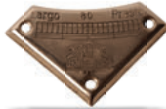
Ses devir göstergesi.