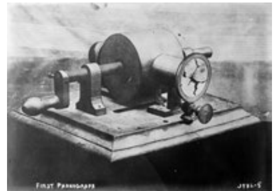
1878. İlk fonograf makinası.