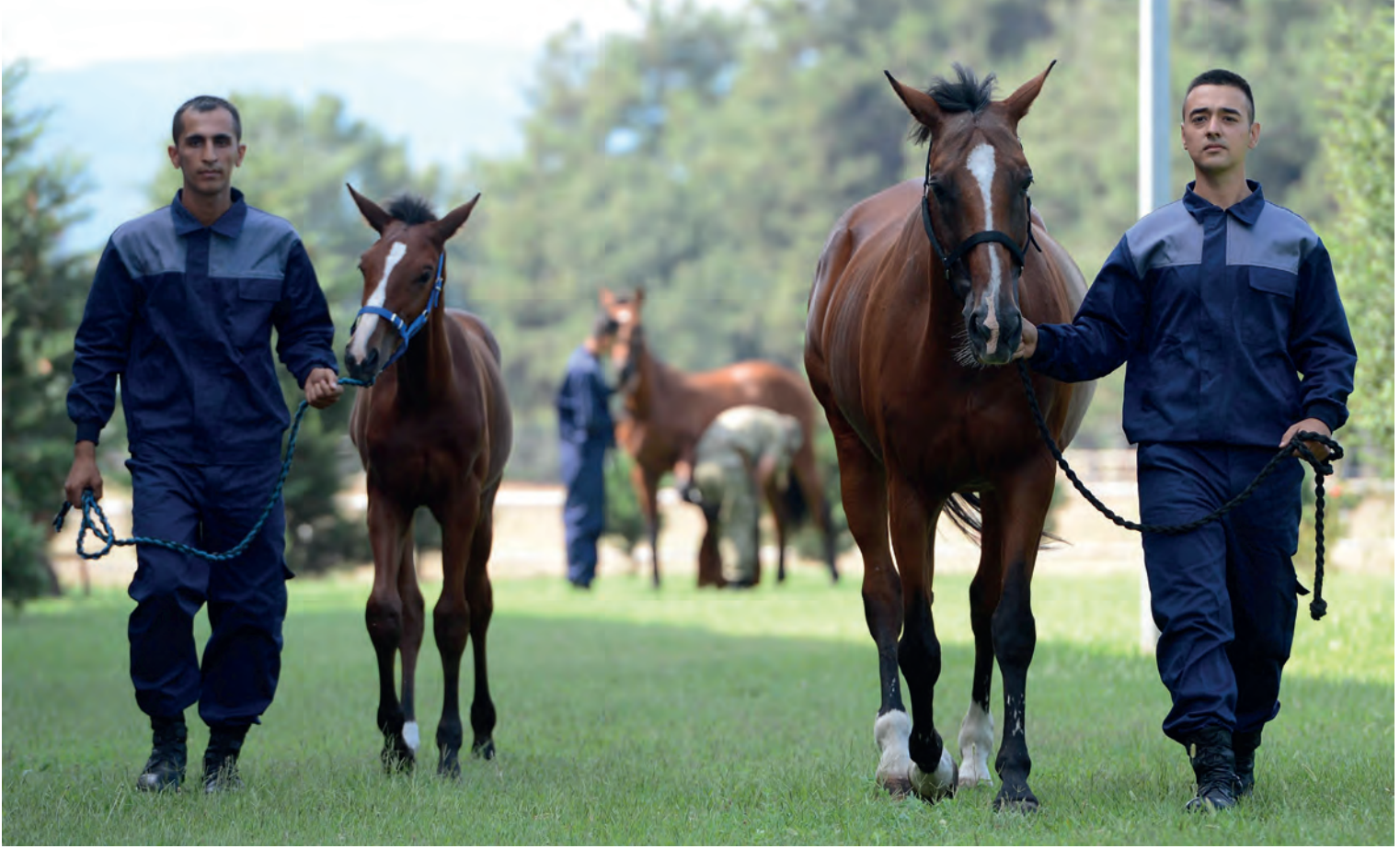
Gemlik atı. Gemlik Askerî Hara.

çak devam ettirilememişti. Bu tipin aslı, Anadolu yerli ırkı kısıraklarla saf kan Arap aygırlardır. Ancak bu basit bir işlem değildir, çünkü yerli kısıraklar ve Arap aygırlarından en iyi yavruyu elde etmek için her iki ırkı uyumlu hâle getirmek gerekmiştir. Bu, çok çeşitli ırk özellikleri taşıyan yerli kısırakların Arap kanını kabul edecek hâle getirilmesi demektir. Bunun için de Çifteler Harası kapatıldıktan sonra Karacabey'e getirilen çok sayıda yarım kan kısırağın varlığı bir şans olmuştur. Daha önceleri melezleme çalışması yapılan Çifteler'de birçok denemeye uygun kısırak materyali vardır. Noniuslar başta