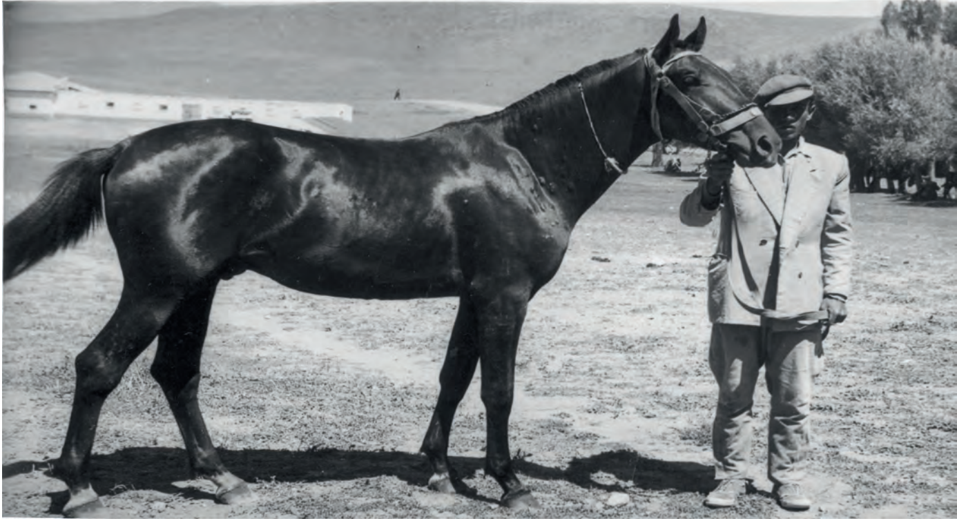
Uzunyayla atı, 1940.

zinin kireçli ve mâdenî maddeler yönünden zengin bir bitki örtüsüne sâhip olması, Uzunyayla'da yetişen atların kuvvetli kemik yapısına sâhip olmalarını sağlamıştır.