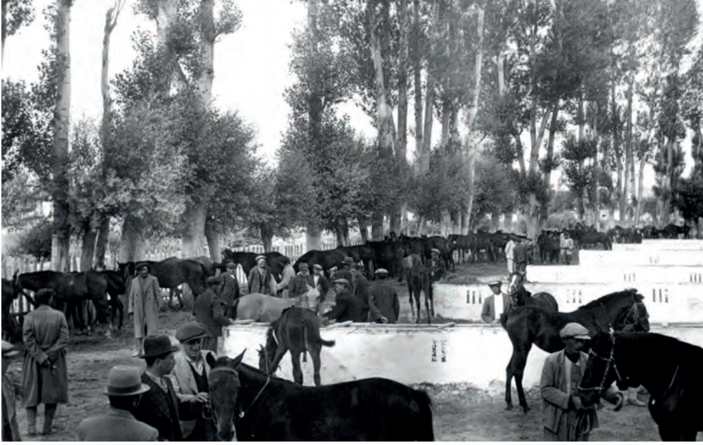
Anadolu'da bir at pazarı, 1940, Kayseri.