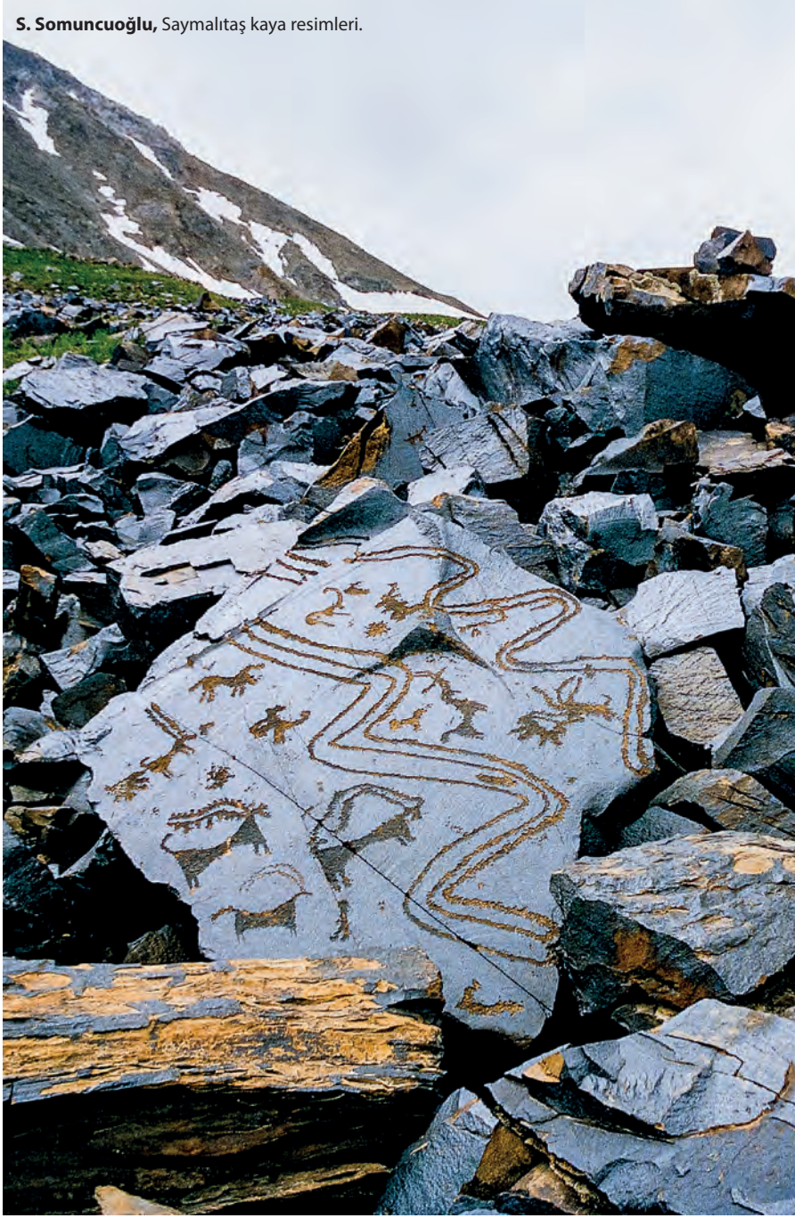
S. Somuncuoğlu, Saymalıtış kaya resimleri.

rini yemiyorlardı. Şamanlık devrinde Türklerin bu hayvanlara tapındıkları da bilinmektedir. Müslümanlığın Türkler tarafından kabul edildiği yıllarda bile, henüz İslâm'la karşılaşmamış olan Ural bölgesindeki Başkurt Türkleri, sayısı 12 olan (kış, yaz, yağmur, ağaç, yel, at, su, gece, gündüz, ölüm, toprak, gök) gibi tabiat tanrılarına tapıyorlardı. Başkurtların yılanlara, balıklara ve turnalara da taptığı bilinmektedir.