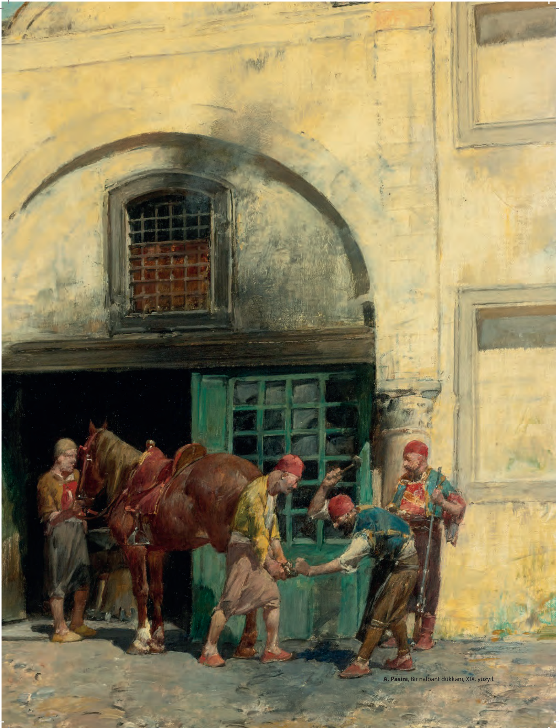
A. Pasini, Bir nalbant dükkanı, XIX. yüzyıl.