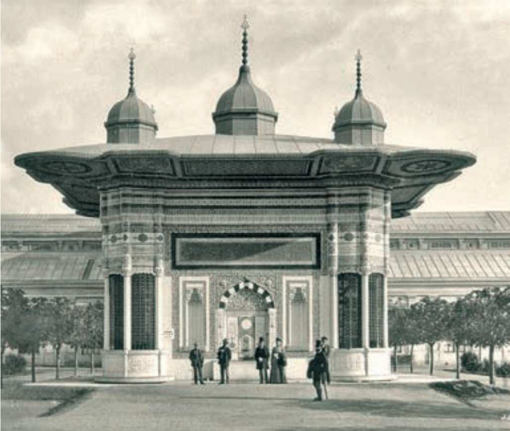
Viyana Dünya Fuarı'nda III. Ahmed Çeşmesi, 1873.

bu kubbelerin içlerinde oyma yazı olan altın yıldızlı tunç alemler bulunur. Bir köşk görünümünde olan çeşme, köşk olarak kullanılmak için 1893 yılına kadar bir benzerinin Chicago'da inşâ edilmesini bekleyecekti.