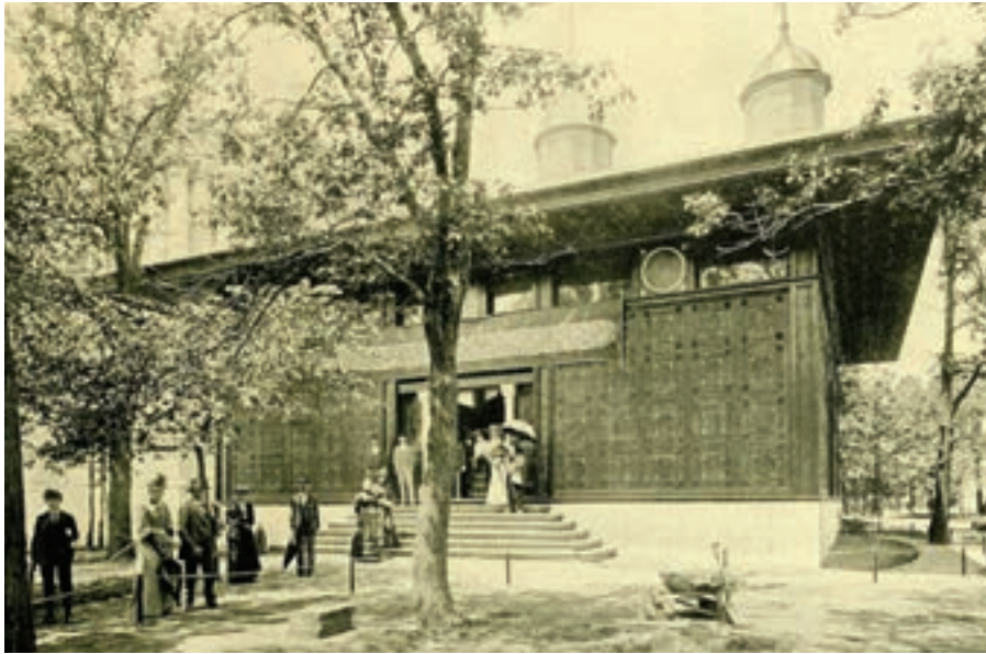
Çeşme mimârîsinden mülhem yapılan Osmanlı pavyonu, Colombia Fuar Albümü.

Sonuç olarak Eyice'nin de ifâde ettiği gibi, “III. Ahmed Çeşmesi, meydan çeşmelerinin bütün Türk sanatı târihi içinde ortaya konulmuş en göz kamaştırıcı örneğidir. Bu anıt, çeşme mîmârîsinde XVIII. yüzyılda başlayan zengin bezemeli yeni akımın da temsilcisi olup bütün benzerlerini aşan bir güzelli-