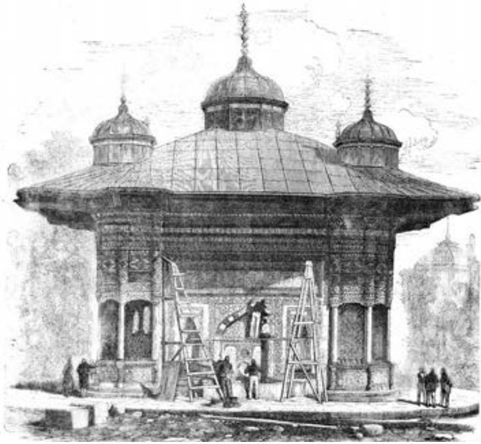
III. Ahmed Çeşmesi replikasında Osmanlı ustaları çalışırken, 1873.