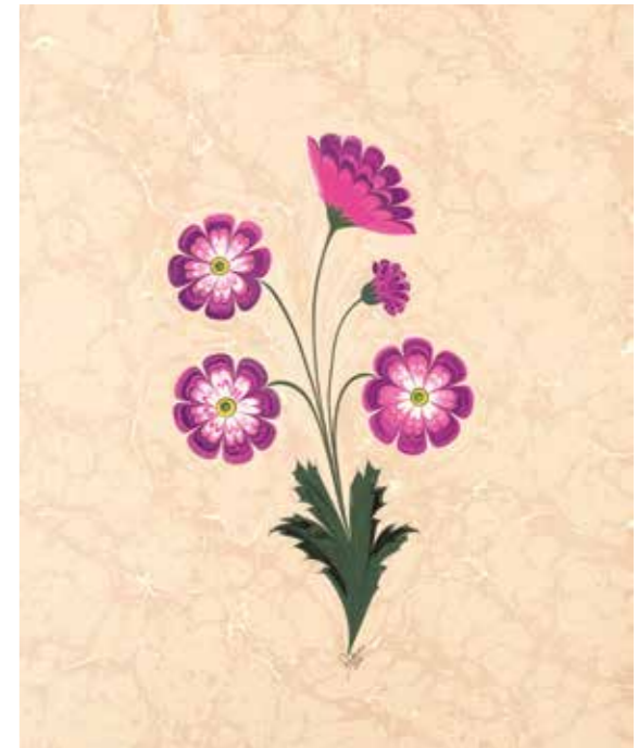
(üst) Kasımpatı, (alt) Helezon karanfil.

Ebru sanatı da diğer sanatlar gibi kendine özgü kuralları olan bir sanattır. Diğer sanatlarla birlikte kullanıldığı veya yardımcı olduğu noktalar olsa da benzerlik anlamında çok şey söylenemez. Benzerlikten ziyade ortak yanlar söz konusudur. En önemli özelliği tüm sanatlarda olduğu gibi bizi gerçek sanatkâra, Yaradan'a yaklaştırma özelliğidir. Tüm geleneksel sanatların özünde olan da budur. Ebru sanatkârının bu arzusu, çiçekli ebrularda gerçeğine en yakın haliyle çiçeği nakşetmesine ve her geçen gün daha yüksek bir sanat zevkiyle eser üretilmesinin de sebebi olmuştur.