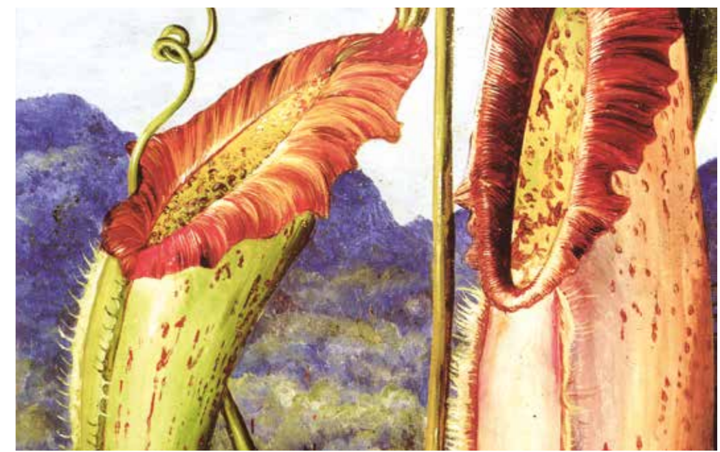
Marianne North eserleri.