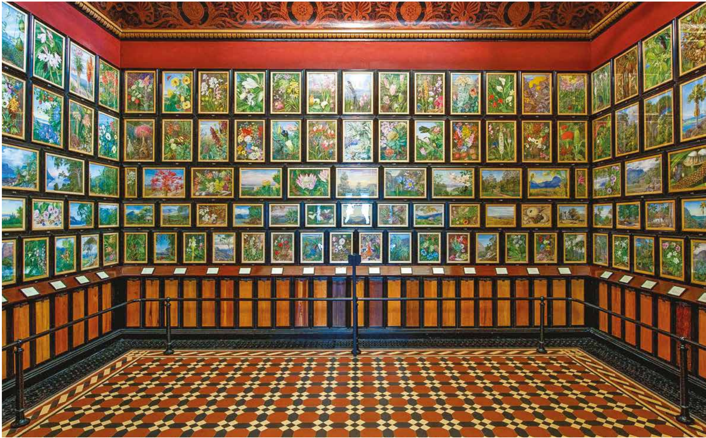
KEW Royal Botanic Gardens galerisi.