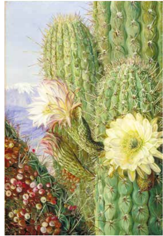
Marianne North eseri.