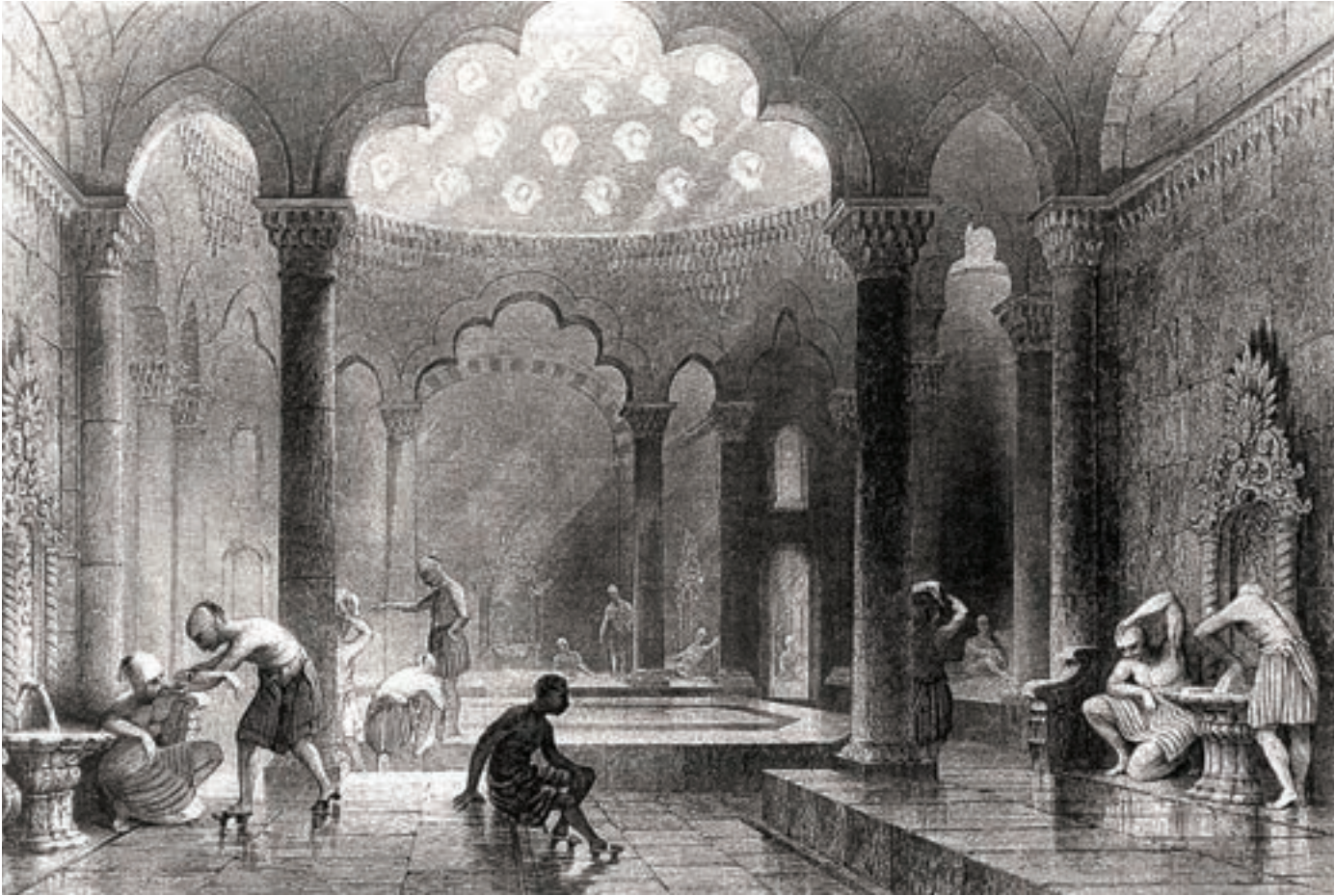
T. Allom, Türk hamamı.