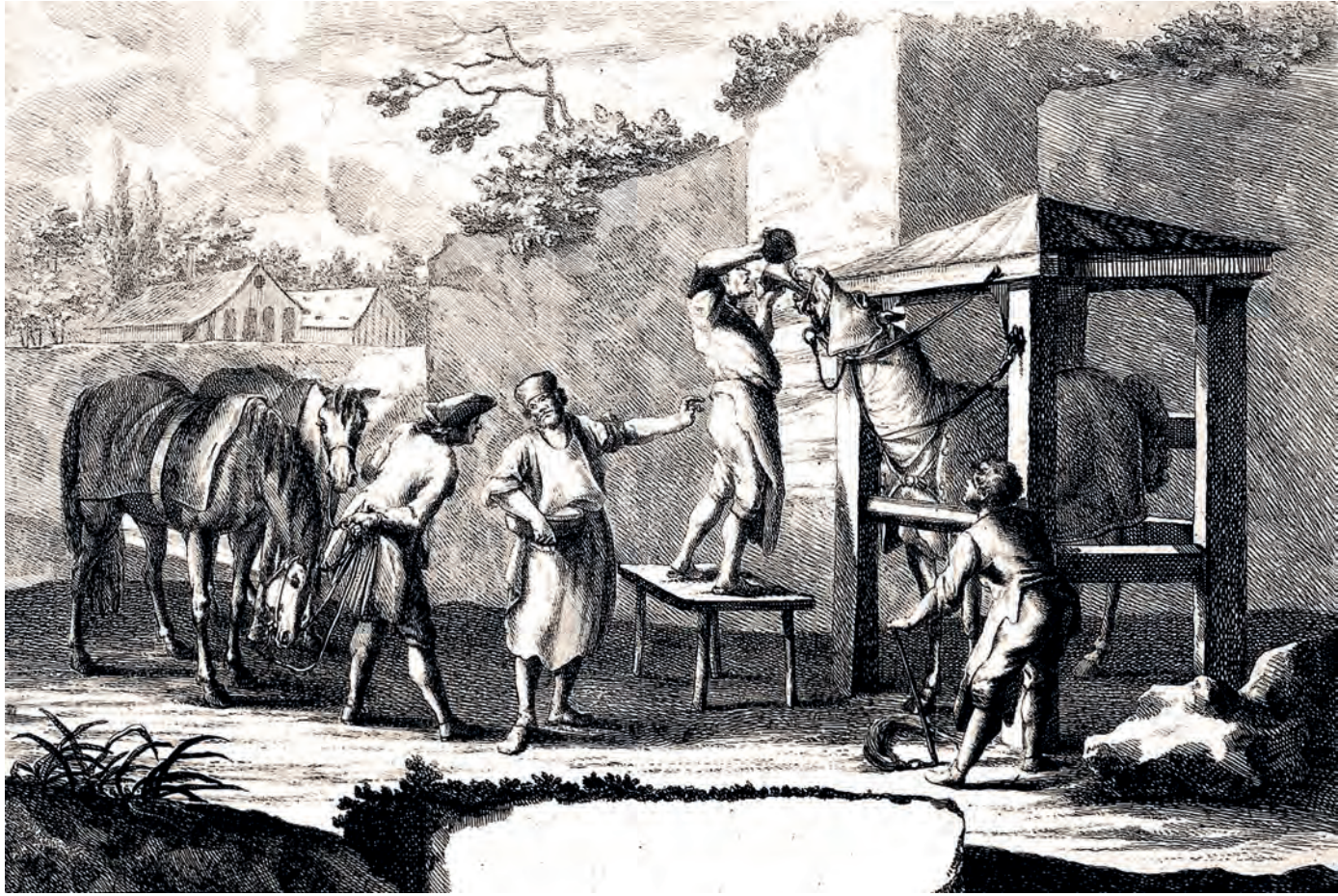
At tedâvisi, gravür, XVIII. yüzyıl. Wellcome Koleksiyonu.